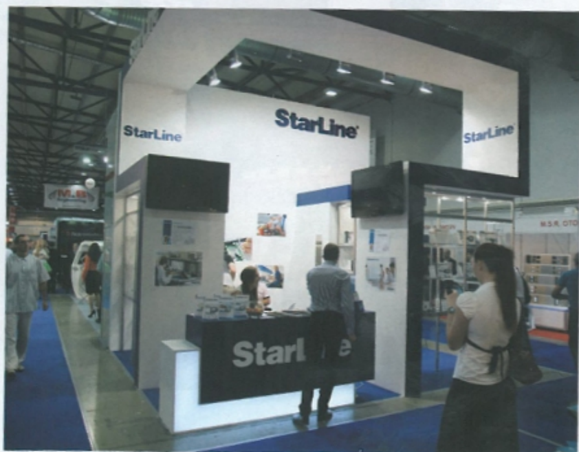
Стенд StarLine на SIA 2013

В рамках SIA 2013 НПО «СтарЛайн» и его эксклюзивный дистрибьютор StarLine Украина («АвтоАудиоЦентр», Харьков) провели конференцию