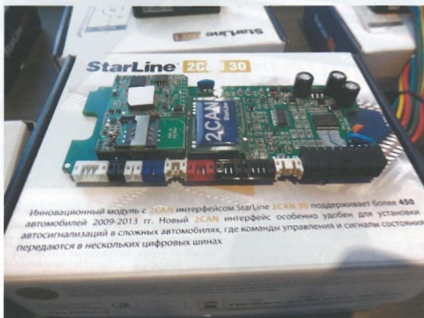
Иновационный модуль с 2CAN интерфейсом StarLine 2CAN 130 поддерживает более 450 автомобилей 2009-2013 гг. Новый 2CAN интерфейс особенно удобен для установки автосигнализаций в сложных автомобилях, где команды управления и сигналы состояния передаются в нескольких цифровых шинах

Важно, что подключение 2CAN-интерфейса обеспечивает полную и безопасную интеграцию в электронику автомобилей, повышает технологичность установки охранно-телематических комплексов StarLine, обеспечивает расширенные функциональные возможности.