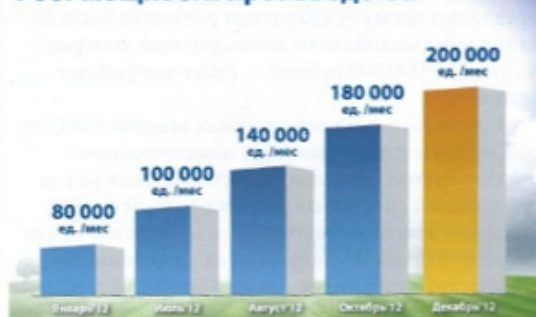
Рост производства StarLine

«StarLine: Доступная Телематика» для ведущих специалистов Украины в области автобезопасности. На конференции присутствовали около 100 участников, в частности, представители автомобильных импортеров (Honda, Ford и другие), оптовых компаний из всех регионов страны, инсталляторы, имеющие опыт работы с оборудованием StarLine, и пока еще только интересующиеся его параметрами. В принципе, у каждого из пришедших, была возможность получить ответы на все интересующие вопросы. Важно, что информация поступала не только от специалистов компании StarLine, но и из незаангажированных источников. Давно известно, что самая лучшая рекомендация для оборудования — признание тех, кто с ним работает! Интересно, что темы диалогов порой выходили за рамки, обусловленные принадлежностью